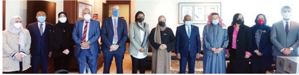
○ رئيس المجلس الأعلى للصحة يستقبل رئيس الجمعية العامة للأمم المتحدة.