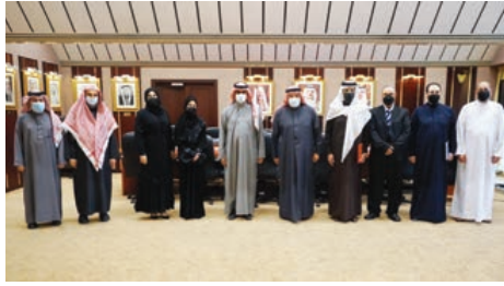
○ وزير العدل خلال تكريم معهد الإمام الشافعي.