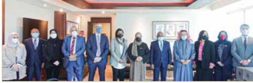
رئيس المجلس الأعلى للصحة مستقبلاً رئيس الجمعية العامة للأمم المتحدة

19) والعمل على احتوائه ومنع انتشاره من خلال اتخاذها لكافة التدابير الوقائية، والاستعدادات المبكرة وتطبيق الإجراءات اللازمة المتوائمة مع المعايير الدولية، مضافاً إلى المبادرات الاجتماعية والاقتصادية. وأكد رئيس الجمعية العامة للأمم المتحدة أن مملكة البحرين أخذت زمام المبادرة في مواجهة جائحة كورونا بوقت مبكر، وتميزت تجربتها بالاستجابة العالية والمبكرة والحاسمة للتعامل مع جائحة فيروس كورونا حيث تعاملت المملكة بنظرة شاملة مع الجائحة، آخذة في الحسبان كافة الجوانب المرتبطة بها، متمنياً لمملكة البحرين دوام التقدم والازدهار والنماء.