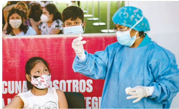
○ طفلة تتلقى جرعة من لقاح فايرز-بيونتيك أمس في ليمّا.

يتمثل في قياس الاستجابة المناعية للمشاركين وليس تقدير فعالية اللقاح. وتجري التجربة في كل أنحاء الولايات المتحدة وجنوب إفريقيا، وتم إعطاء الحقنة الأولى لمشارك في ولاية نورث كارولاينا. ويقسم المشاركون في التجربة إلى ثلاث مجموعات. تشمل المجموعة الأولى أشخاصا تلقوا جرعتين من لقاح فايرز-بيونتيك قبل ٩٠ إلى ١٨٠ يوما من التجربة، وستلقى هؤلاء جرعة أو جرعتين من اللقاح الجديد. وتضم الثانية أفرادا تلقوا جرعتهم الثالثة أو الجرعة المعززة قبل الفترة نفسها، وسيحصل هؤلاء على جرعة جديدة من اللقاح الأساسي أو جرعة من اللقاح المطور ضد أوميكرون. أما المجموعة الثالثة فتشمل أشخاصا لم يتلقوا أي لقاح ضد كوفيد-19، وسيحصلون على ثلاث جرعات من اللقاح المصمم ضد المتحوّرة أوميكرون. واللقاح الأولي الذي طوره «فايرز» و«بيونتيك»، كان أول لقاح يحصل على الضوء الأخضر في الدول الغربية، في ديسمبر ٢٠٢٠.